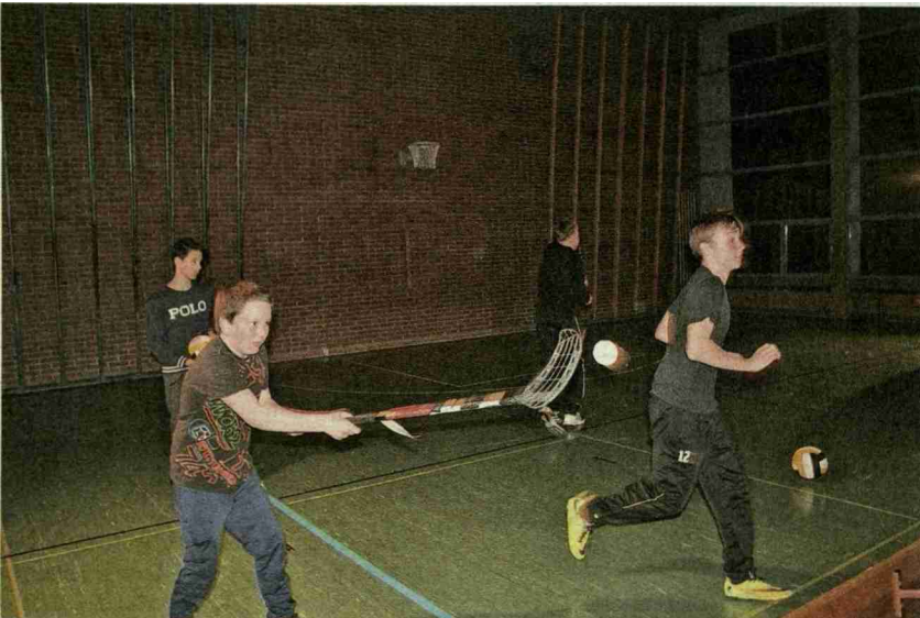
Die Jugendlichen hatten ihren Spass bei den sportlichen Aktivitäten.