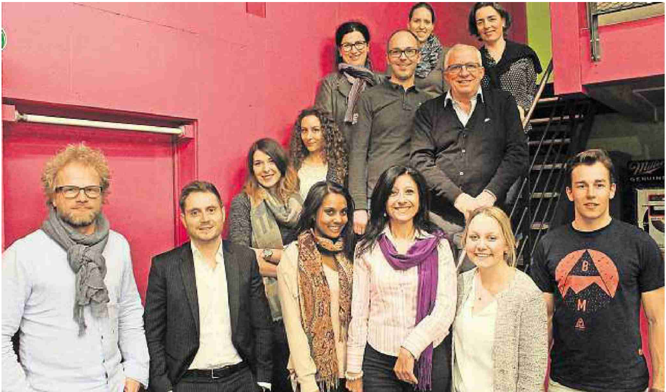
Das fast vollständige, aktuelle Leiter- und Vorstandsteam im Jugendhaus Oase.

KÜSSNACHT Bei den Verantwortlichen für die Jugendarbeit herrschte bei der Rückschau auf das vergangene Jahr viel Zufriedenheit. Die Besucherzahlen in der «Oase» sind markant gestiegen.