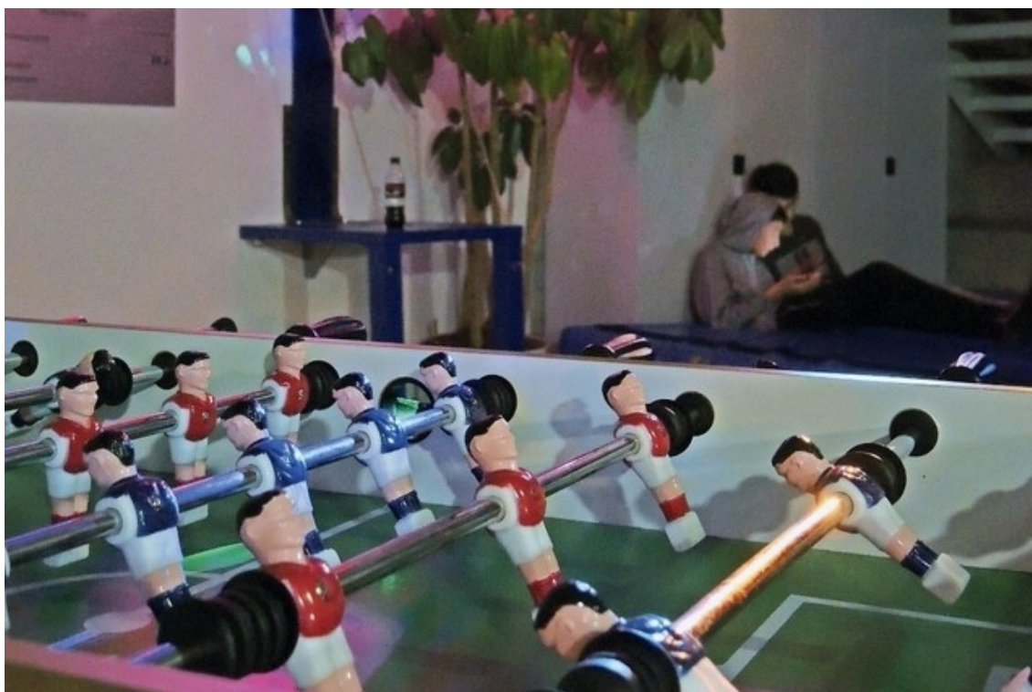
Entspannung und Bewegung: Im Eingangsbereich der Turnhalle Berg in Rikon können sich die Jugendlichen erholen, in der Halle Sport treiben.

Jugendliche haben wenige Freiräume, besonders auf dem Land. Einer der letzten ist die Turnhalle. Ein Besuch des Projekts Midnight Sports am vergangenen Samstagabend in Bauma, Turbenthal und Rikon.