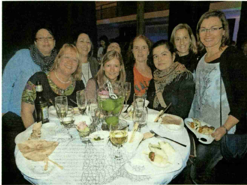
Die Fraktion vom Mittagstisch Guntershausen.

Themen-Nr.: 042.003 Abo-Nr.: 1068396 Seite: 4 Fläche: 63'152 mm 2