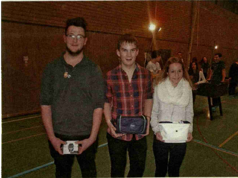
Die glücklichen Preisträger.

Themen-Nr.: 042.003 Abo-Nr.: 1068396 Seite: 1 Fläche: 90'935 mm 2