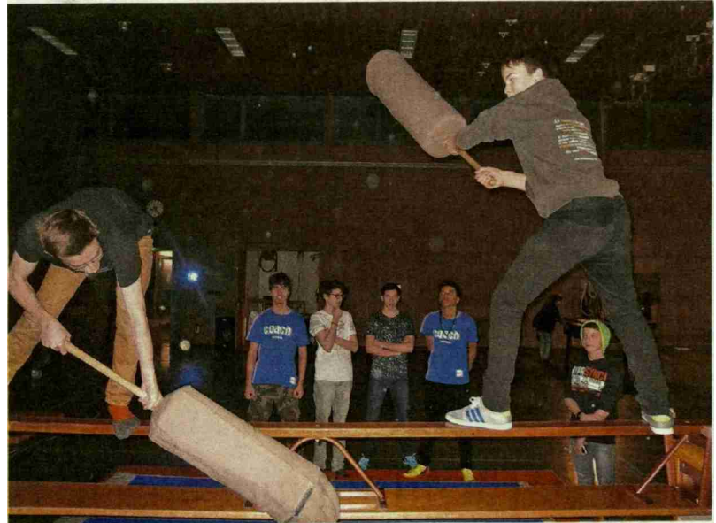
Kampf der Gladiatoren.