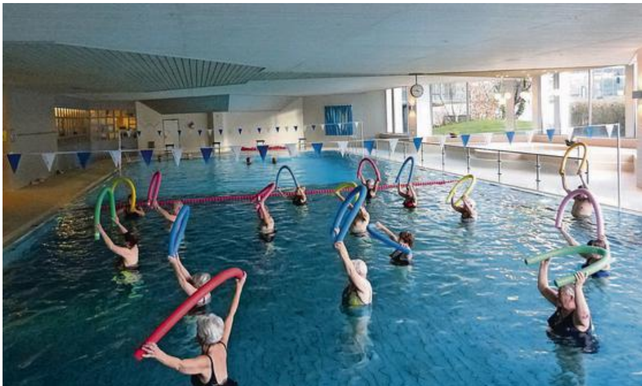
Aquafit im Aadorfer Hallenbad. Die Gemeindeversammlung genehmigte die Sanierung der Decke.