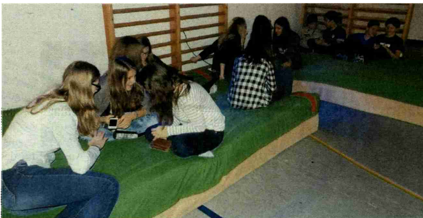
Chillen auf Turnmatten ist eine beliebte Beschäftigung.

Themen-Nr.: 042.003 Abo-Nr.: 1068396 Seite: 4 Fläche: 71'755 mm 2